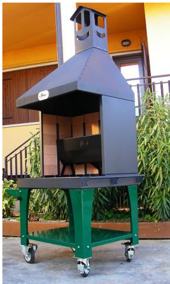
Dimensioni larg. 100 x prof. 78 x altezza 265 cm. – Peso circa 250 kg.

Non rientrano nella dotazione standard: griglie, palette e accessori non indicati.